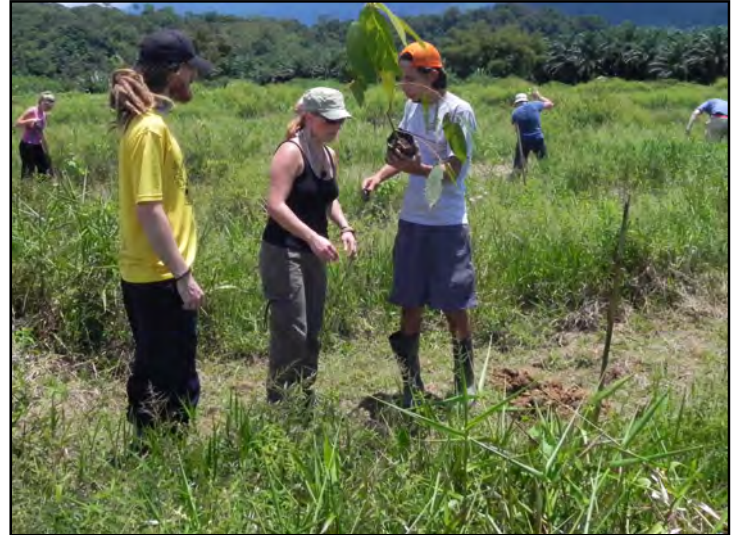
VolontärInnen pflanzen Jungbäume auf der Finca Amable.