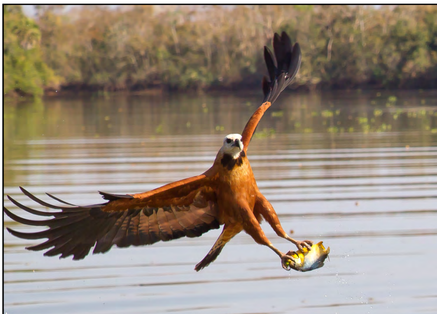
Fischbussard im Pantanal (Foto: Richard Kunz).

Reservierungen per E-Mail oder Telefon: info@regenwald.at oder +43 1 470 19 35.