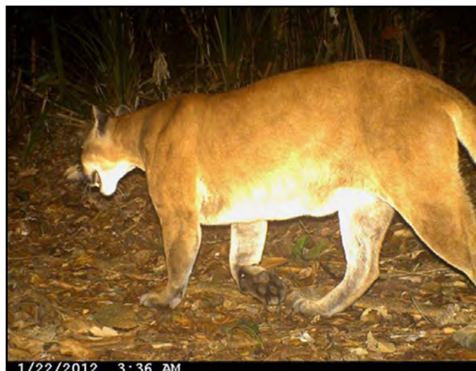
Puma auf dem Fila Trail oberhalb der Esquinas Lodge.

Während die Population von Jaguaren immer noch stark gefährdet ist, scheint sich die Population von Ozelots und Pumas im Regenwald der Österreicher langsam zu erholen. Die Vorfälle mit gerissenen Haustieren mehren sich, und die Mitarbeiter unserer Partnerorganisation Yaguará sind in Zusammenarbeit mit der Parkbehörde bemüht, angemessene Entschädigungen an die Bauern zu zahlen. Leider ist die Wilderei nach wie vor ein Problem, und daher ist der Einsatz von Wildhütern im Nationalpark äußerst wichtig. Wir konnten das Leben eines Baumozelots retten, indem wir einer Gruppe von Jägern das verschreckte, eingefangene Tier um 90 Euro abgekauft und der Parkverwaltung zur Auswilderung übergeben haben. Bitte denken Sie daran, dass Ihre Spenden auch für die Bezahlung von Wildhütern und für den Schutz der Wildkatzen verwendet werden. Patenschaften für einen Jaguar oder einen Ozelot sind ein sinnvolles Weihnachtsgeschenk für jung und alt!