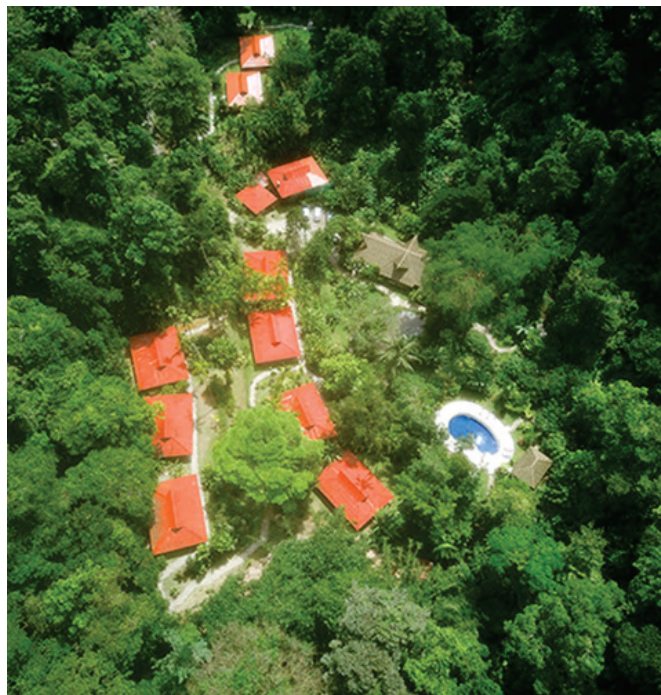
Die Esquinas Rainforest Lodge liegt im Herzen des Regenwaldes der Österreicher; www.esquinaslodge.com

2019 verzeichnete die Lodge 2.400 Übernachtungen, Reservierungen gehen bis 2023. Gerne schicke ich Ihnen eine ausführliche Beschreibung der Lodge als PDF und stehe Ihnen für ein persönliches Gespräch zur Verfügung. Bitte schreiben Sie an meine private E-Mailadresse golfito1@icloud.com