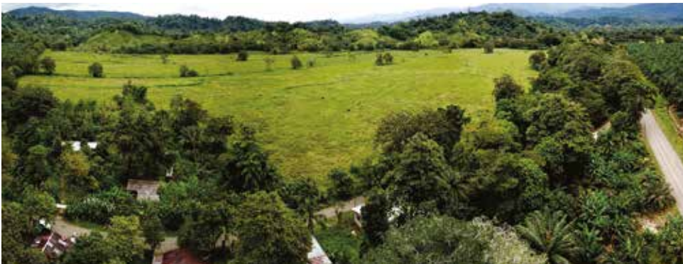
Die Finca Marina (187 ha) ist ein notwendiger Teil für den Biologischen Korridor COBIGA und bestens für Wiederbewaldungen geeignet.