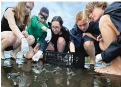
Schildkrötenprojekt am Playa Hermosa

Am 23. Juni 2023 konnten wir die Finca La Virgen (6 ha) am Fuße der Fila Cal erwerben und in den Biologischen Korridor COBIGA eingliedern. Gleich in der Nachbarschaft der Finca Virgen wurde leider illegal abgeholzt und die Nationalparkbehörde wurde umgehend informiert. Vorfälle wie diese zeigen einmal mehr, wie wichtig unsere Naturschutzaktivitäten in La Gamba sind.