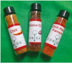
Chili, Choco Chili und Chili Habanero Panama

Handverlesene und schonend verarbeitete Gewürze und Schokolade aus dem Regenwald der Österreicher. Diese werden biologisch nachhaltig und fair produziert. Solange der Vorrat reicht, erhalten Sie eine Regenwald-Schokolade als Dankeschön ab einer Spende von € 8,--. Unser Chili, Choco Chili, Chili Habanero Panama sind gegen eine Spende ab € 5,-- erhältlich. Zuzüglich Porto.