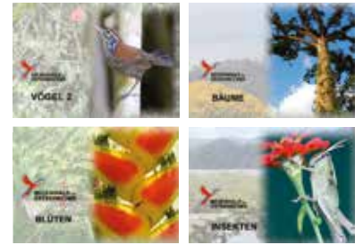
Fotobücher Vögel, Bäume, Blüten und Insekten

Impressum: Regenwaldnachrichten 11/2023 Herausgeber und Medieninhaber: Regenwald der Österreicher (Verein zum Erhalt der Biodiversität im Süden Costa Ricas, ZVR Nr. 144799242); Koniczekweg 9, 1140 Wien. Telefon: +43 664 204 26 29 Redaktion: Dr. Anton Weissenhofer Fotos: (c) Regenwald der Österreicher; Tropenstation La Gamba, Ulrike Goldschmid, Fundación Corcovado Alle Rechte vorbehalten. DVR: 0741515 Österreichische Post AG/ Sponsoring. Post 03Z0355238 S Abs.: Regenwald d. Ö., Koniczekweg 9, 1140 Wien