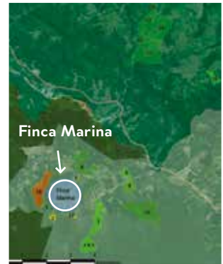
Lage der Finca Marina im Biologischen Korridor COBIGA

Schenken Sie Regenwaldurkunden zu Weihnachten und leisten Sie einen wertvollen Beitrag für die Erweiterung des Biologischen Korridors COBIGA.